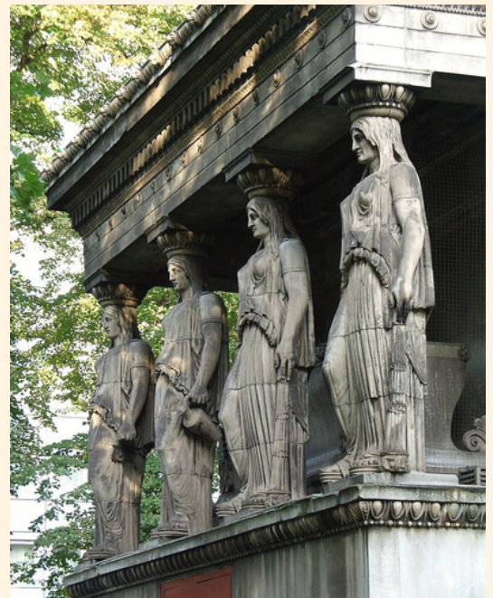
Entre sus gemas están las cariátides o "jóvenes sin vientre" que sostienen el suntuoso portal norte.

Hay una de las más legendarias iglesias de Londres que, lamentablemente hay que decirlo, el intenso tráfico de Euston Road le ha quitado un poco de esplendor. ¡Sin embargo, está ahí y debes re-descubrirla! Se llama la Iglesia de Saint Pancreas sobre la misma Euston Road, Camden Ver sitio St Pancras Church